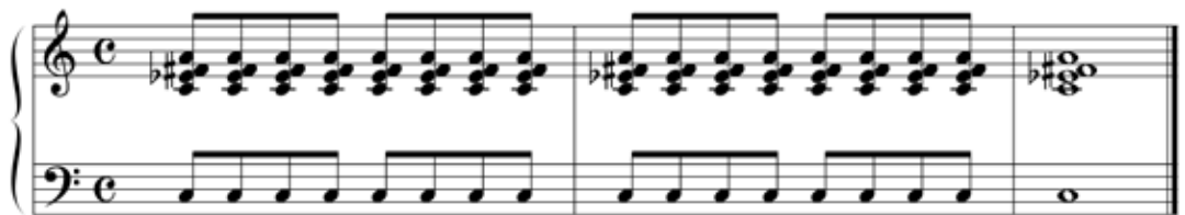
Abbildung 7: Verminderte Septakkorde in großer Lautstärke können ein Gefühl von Entsetzen und Panik zum Ausdruck bringen (Willimek und Willimek 2019, 52).

Schon Arnold Schönberg beschrieb den verminderten Septakkord (siehe Abbildung 7) als Ausdruck des Schreckens und Entsetzens (vgl. Schönberg 1922, 288). Der Akkord enthält mit Terz, Septime und None mehrere intensiv wahrgenommene Leittöne (vgl. Honegger und Massenkeil 1981, 92 f), die die Strebetendenz-Theorie als mehrfache Identifikation des Hörers mit dem Widerstand gegen die Rückauflösung nach Moll beschreibt. Das kann die Vorstellung von einem panischen Sich-mit-Händen-und-Füßen-Wehren erzeugen.