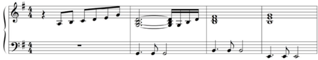
Abbildung 6: Die Anfangstakte von „Samba pa ti“ stehen in äolischem Moll. Sie klingen nicht traurig, sondern abenteuerlich. 1