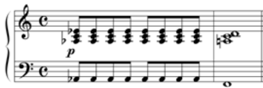
Abbildung 12: Obwohl der Schlussakkord in diesem Beispiel mit dem in Abbildung 11 identisch ist, wirkt er anders, da er hier keine Subdominante ist. (Willimek und Willimek 2019, 87).