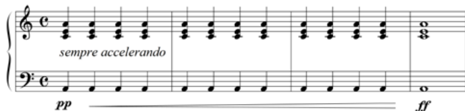
Abbildung 3: Wiederholt man einen Mollakkord zunächst langsam und leise, wird dann immer schneller und lauter, kann man die Vorstellung erzeugen, Trauer verwandele sich in Wut (Willimek und Willimek 2019, 26).

Im Sinne der Strebetendenz-Theorie entspricht der Mollakkord von seinem Ausdrucksgehalt her der Aussage „ ich will nicht mehr “. Würde man diese Worte leise flüstern, klängen sie traurig , würde man sie laut heraus-schreien, klängen sie wütend . Diese Unterscheidung kann sich in der emotionalen Wirkung des Mollakkords widerspiegeln. Wer einen Mollakkord zunächst leise und dann immer lauter repetiert, kann auf eindrucksvolle Weise eine Verwandlung des Ausdrucks von Trauer in Wut nachvollziehen (siehe Abbildung 3).