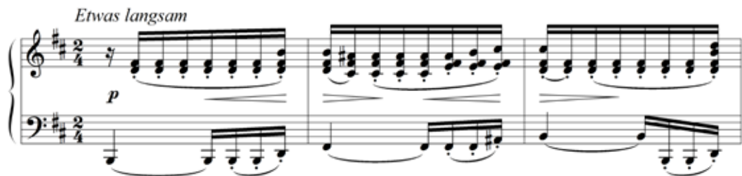
Abbildung 5: Im Lied „Die liebe Farbe“ von Franz Schubert klingen die Durakkorde im zweiten Takt ebenso traurig wie die Mollakkorde im ersten und dritten Takt (vgl. Schubert und Müller 1985, 41).

Ein Beispiel für trauriges Dur sind die Anfangstakte des Liedes „Die liebe Farbe“ von Franz Schubert (siehe Abbildung 5). Die Durakkorde im zweiten Takt scheinen den traurigen Charakter der Mollakkorde des dritten Taktes vorwegzunehmen, so dass die Duraufhellung ausbleibt.