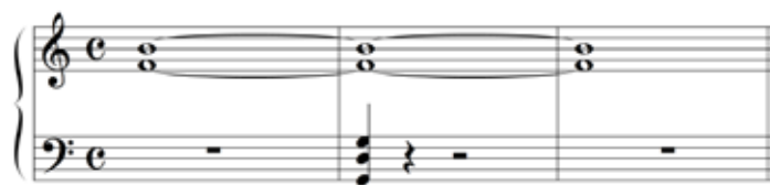
Abbildung 16: Durch den Klang der Basstöne verliert der Tritonus seinen „teuflischen“ Charakter (Willimek und Willimek 2019, 109).

Dass die Ambivalenz der beiden Leitöne beim Tritonus ausschlaggebend für seinen Klangcharakter ist, bestätigt sich, wenn wir zum klingenden Tritonus kurz einen anderen Klang anschlagen, der den beiden Tönen des Tritonus ihre Rolle im Dominantseptakkord zuweist und damit seine Leitöne gerichtet erscheinen lässt. Das wird im folgenden Notenbeispiel gezeigt. Der Tritonus klingt – nachdem die Töne im Bass verklungen sind – nicht mehr „teuflisch“, sondern „harmlos“.