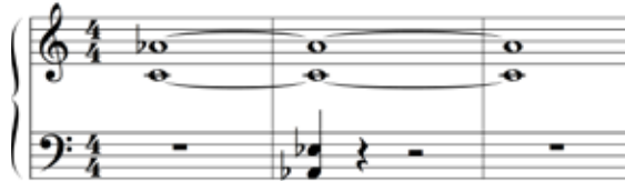
Abbildung 18: Aufgrund der hinzugefügten Töne im Bass kann die kleine Sexte ihre furchtsame Wirkung verlieren (Willimek und Willimek 2019, 106).

Diese Begründung für die furchtsame Wirkung der kleinen Sexte wird durch folgendes Klangbeispiel bestätigt. Dabei wird der kleinen Sexte durch einen weiteren Klang im Bass, der das Intervall zu einem Durakkord vervollständigt, eine Funktion innerhalb dieses Durakkords zugewiesen. Dadurch verliert der Leitton (hier das as ) seine Leittoneigenschaft, und die kleine Sexte klingt nicht mehr furchtsam.