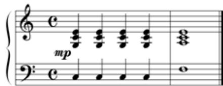
Abbildung 9: Die Subdominante mit großer Septime, der Schlussakkord dieses Musikbeispiels, kann ein Gefühl von Wehmut zum Ausdruck bringen (Willimek und Willimek 2019, 82).

„Wehmut heißt der Affekt der Traurigkeit, der entweder der Erinnerung an eine vergangene Lust, an ein verlorenes Gut oder der Einsicht in die Unmöglichkeit, ein ersehntes Gut zu erlangen, entspringt. Es mischt sich in jene Traurigkeit auch ein Gefühl der Lust.“