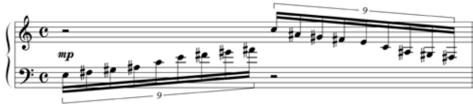
Abbildung 14: Die Ganztonskala kann ein Gefühl von Schwerelosigkeit erzeugen (Willimek und Willimek 2019, 102).