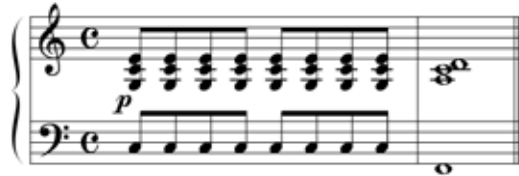
Abbildung 11: Der Schlussakkord dieses Musikbeispiels ist eine Subdominante (Willimek und Willimek 2019, 87).

Dass der Klangcharakter aus der Auflösungserwartung des Hörers herrührt, lässt sich anhand des folgenden Experiments nachvollziehen. Hierzu spiele man die Musikbeispiele in Abbildung 11 und 12. Dabei beachte man, dass der Schlussakkord in Abbildung 12 mit demjenigen in Abbildung 11 identisch ist. Dennoch ist seine Wirkung ganz anders. Er klingt nicht geborgen, sondern eher gegenteilig: einsam und verloren. Der Grund: In Abbildung 12 hat der Schlussakkord wegen der Anfangsakkorde keine subdominante Funktion. Seine Leittonwirkung ist daher eine andere.