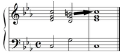
Abbildung 4: Nach üblicher Auffassung strebt der Ton h in diesem Beispiel ins c (Pfeil). Laut Strebetendenz-Theorie identifiziert sich der Hörer jedoch beim Ton h mit einem Willen gegen die Rückauflösung des h nach c-Moll, da er die Molltonart im Gedächtnis hat. Dann erlebt der Hörer den traurigen Charakter des c-Mollakkords bereits beim G-Durakkord voraus.

er die Durdominante hört, voraus. Der Durakkord kann dann den traurigen Charakter des Moll übernehmen und die Duraufhellung bleibt aus (Siehe Abbildung 4).